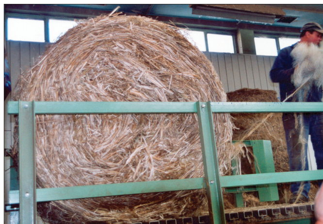
Při zpracování konopí v Lence Kácov, říjen 2003